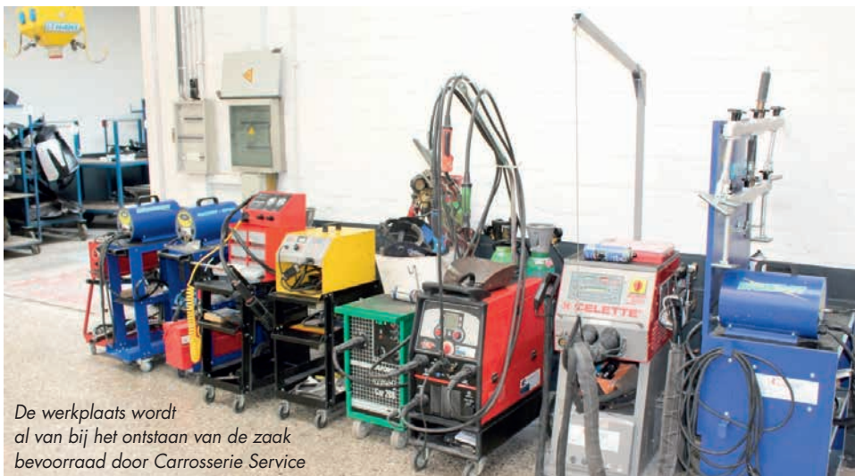
De werkplaats wordt al van bij het ontstaan van de zaak bevoorrad door Carrosserie Service

"Het geeft ons ook een soort bewijs voor de klant én voor onszelf. Met de digitale rapporten van de meting kunnen wij haarfijn aantonen dat een herstelling naar behoren werd uitgevoerd voor de wagen de poort uitreed. Via de website zitten die rapporten mooi gearchiveerd in de cloud."