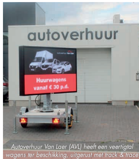
Autoverhuur Van Laer (AVL) heeft een veertigtal wagens ter beschikking, uitgerust met track & trace